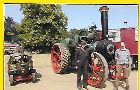
STEAM IN MINIATURE AT BRESSINGHAM