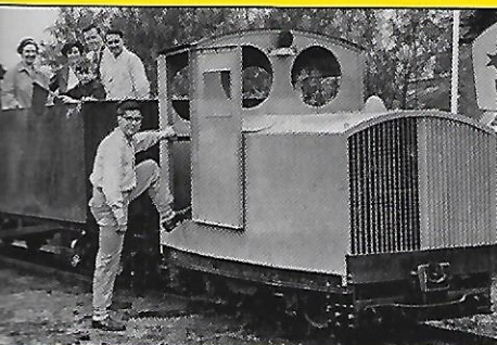
HERITAGE LINE CELEBRATES 60 YEARS