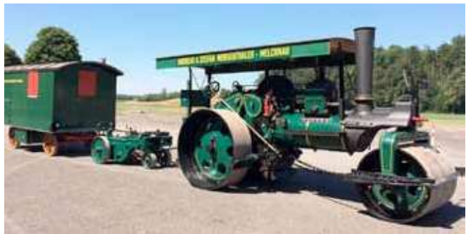
◀ Zettelmeyer roller No 572 at Bleienbach with the 'short' road train comprising a trailed scarifier and the Kumlin living van. ▶ The roller with the relatively newly-acquired coal wagon in tow.