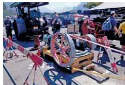
The 1890 single cylinder Sulzer engine being run on steam provided by the Zettelmeyer roller at the DWCS 'Steam Days' event held at Brienz in July 2018.