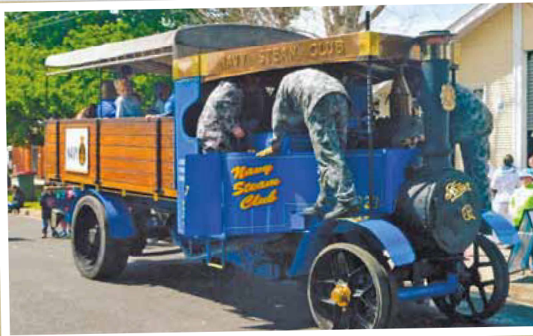
The Navy Steam Club's 1923 Foden wagon loads up with excited young passengers ready for another tour of the base.

However, it was a somewhat strange-looking engine which caught the eye; investigations revealed it to be a